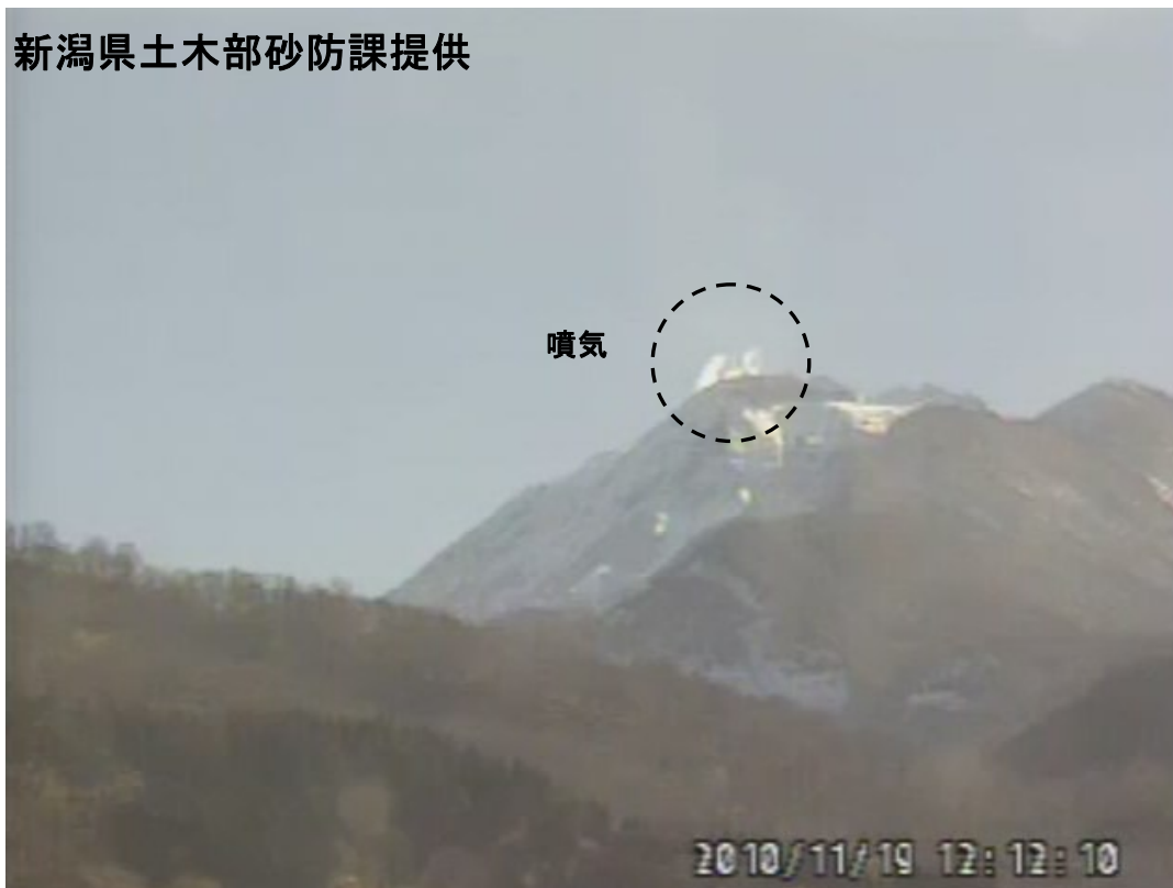
図 1※ 新潟焼山 山頂部の状況（11 月 19 日、山頂の北北西約 8 km にある焼山温泉監視カメラによる）

新潟焼山付近を震源とする地震の発生回数は少なく、地震活動は静穏に経過しました。 火山性微動は観測されませんでした。