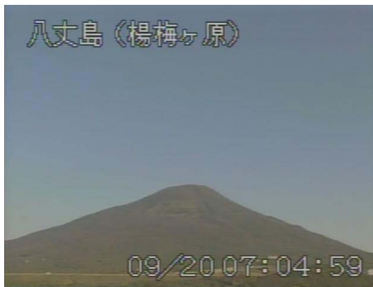
図 1 八丈島 山頂部の状況 (9月20日 楊梅ヶ原遠望カメラによる)

八丈島付近を震源とする地震回数は少なく、地震活動は静穏に経過した。 火山性微動は観測されませんでした。