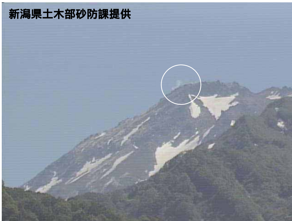
図 1 新潟焼山 山頂部の状況（6 月 2 日、山頂の北北西約 8 km にある焼山温泉監視カメラによる） 白円内は従来から見られている弱い噴気

新潟焼山付近を震源とする地震の発生回数は少なく、地震活動は静穏に経過しました。火山性微動は観測されませんでした。