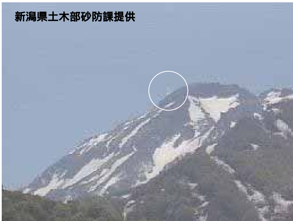
図 1 新潟焼山 山頂部の状況（5 月 18 日、山頂の北北西約 8 km にある焼山温泉監視カメラによる） 白円内は従来から見られている弱い噴気

新潟焼山付近を震源とする地震の発生回数は少なく、地震活動は静穏に経過しました。 火山性微動は観測されませんでした。