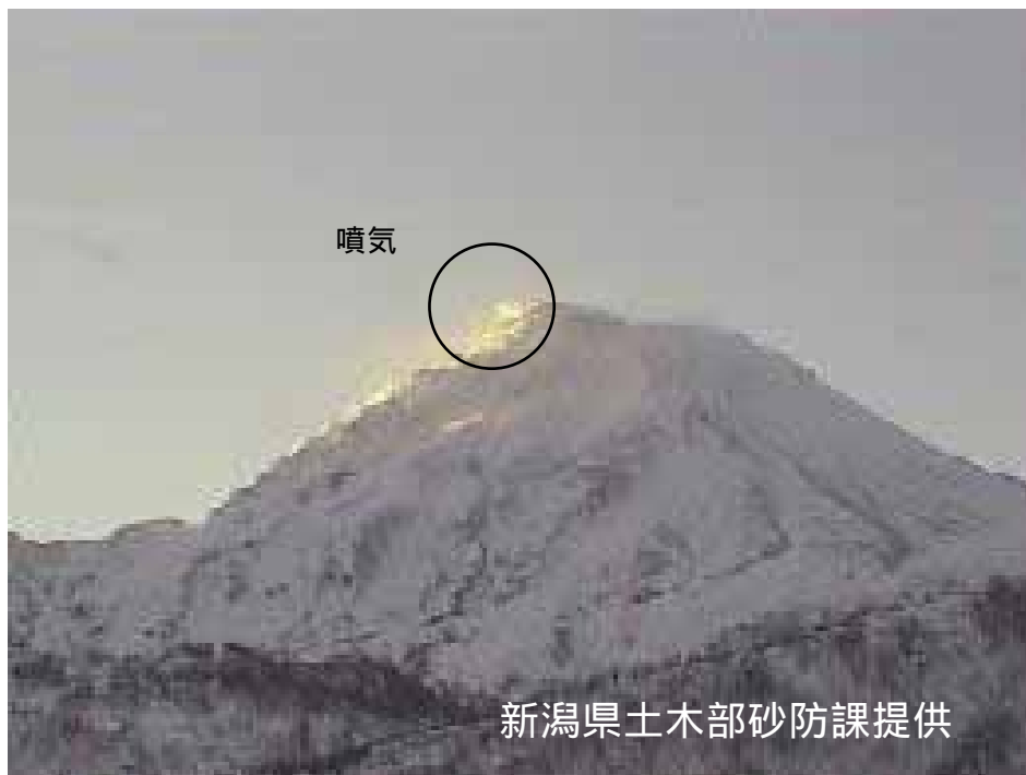
図 1 新潟焼山 北側から見た山頂部の状況（1 月 14 日、焼山温泉監視カメラによる） 黒円内は従来から見られている山頂部東側斜面の弱い噴気です。

新潟焼山付近を震源とする地震の発生回数は少なく、地震活動は静穏に経過しました。 火山性微動は観測されませんでした。