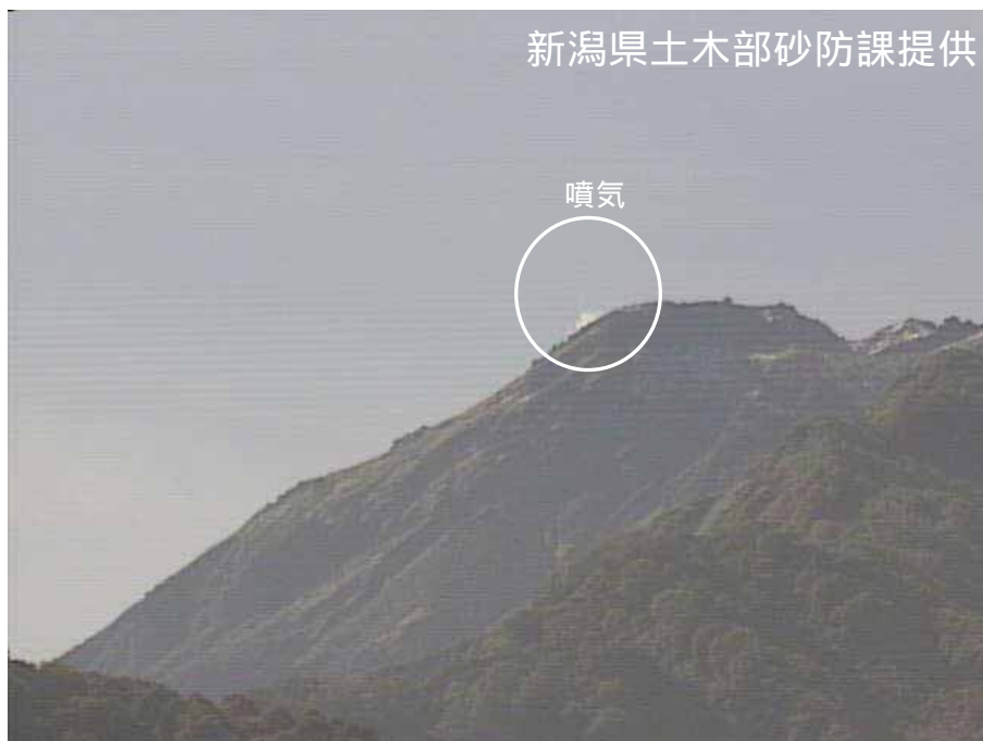
図 1 新潟焼山 北側から見た山頂部の状況（30 日、焼山温泉監視カメラによる） 白円内は従来から見られている山頂部東側斜面の弱い噴気です。

新潟焼山付近を震源とする地震の発生回数は少なく、地震活動は静穏に経過しました。 火山性微動は観測されませんでした。