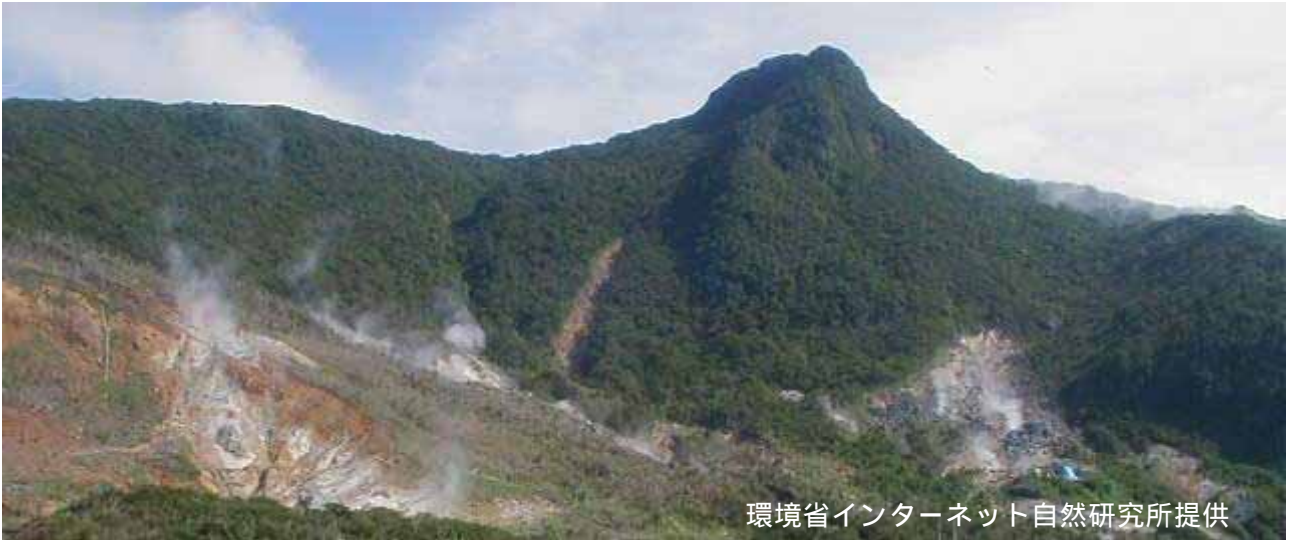
図2 大涌谷の状況(6月24日、環境省インターネット自然研究所の箱根・大涌谷カメラによる)