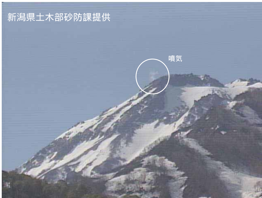
図 1 新潟焼山 北側から見た山頂部の状況（5 月 3 日、焼山温泉監視カメラによる） 白円内は従来から見られている弱い噴気です。

新潟焼山付近を震源とする地震の発生回数は少なく、地震活動は静穏に経過しました。 火山性微動は観測されませんでした。