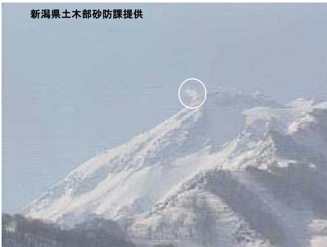
図 1※ 新潟焼山 北側から見た山頂部の状況（4月6日、焼山温泉監視カメラによる） 白円内は従来から見られている弱い噴気です。

新潟焼山付近を震源とする地震の発生回数は少なく、地震活動は静穏に経過しました。 火山性微動は観測されませんでした。