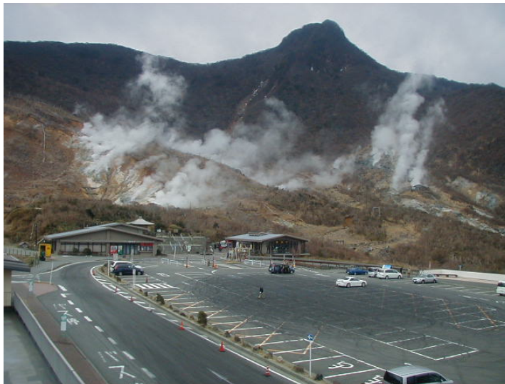
図 1※ 箱根山 大涌谷の状況（3 月 30 日、箱根・大涌谷カメラによる）

1) センサーで周囲の岩盤から受ける力による体積の変化をとらえ、岩石の伸びや縮みを精密に観測する機器。火山体直下へのマグマの注入等により変化が観測されることがあります。