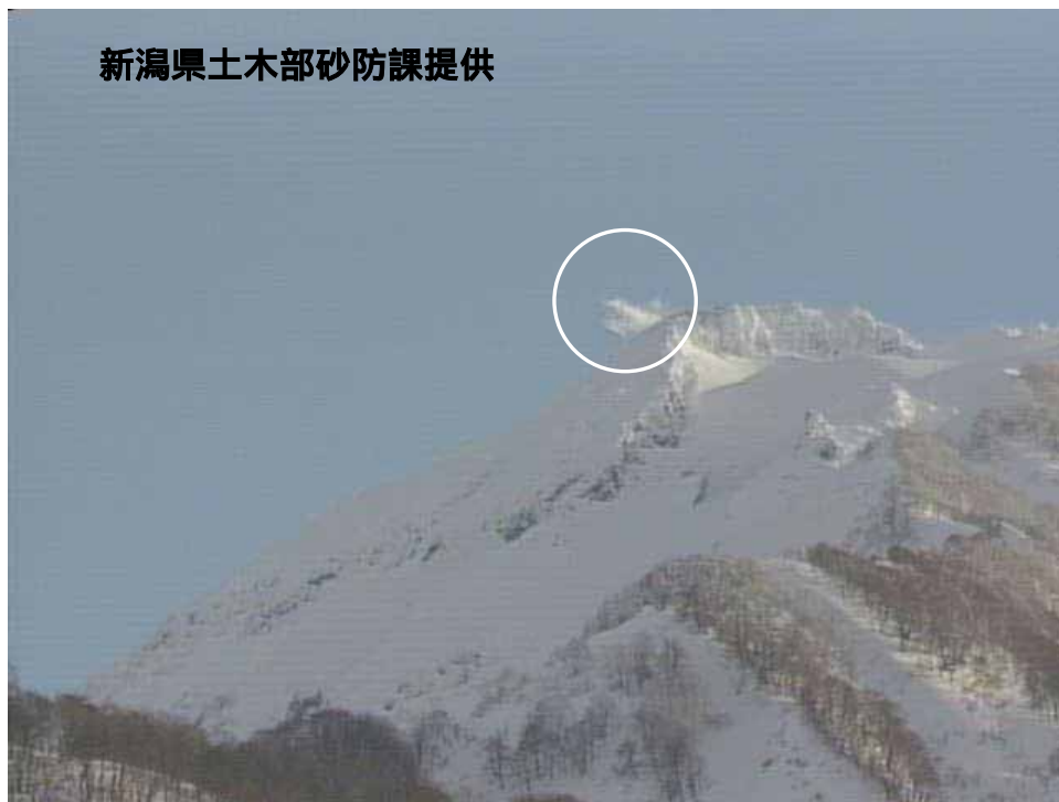
図 1 新潟焼山 北側から見た山頂部の状況（1 月 15 日、焼山温泉監視カメラによる） 白円内は従来から見られている弱い噴気です。

新潟焼山付近を震源とする地震の発生回数は少なく、地震活動は静穏に経過しました。 火山性微動は観測されませんでした。