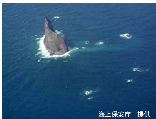
図 1 須美寿島 変色水の状況（2005 年 3 月 8 日）

3月8日に海上保安庁が上空から行った観測によると、噴気等は確認されませんでした。島の南端から東へ延びる幅約 150m、長さ約 600m の黄緑色変色水が確認されましたが（図 1）、火山活動の高まりを示すものではないと考えられます。