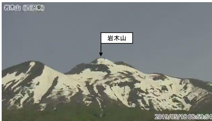
図1 岩木山 山頂部の状況（5月18日）