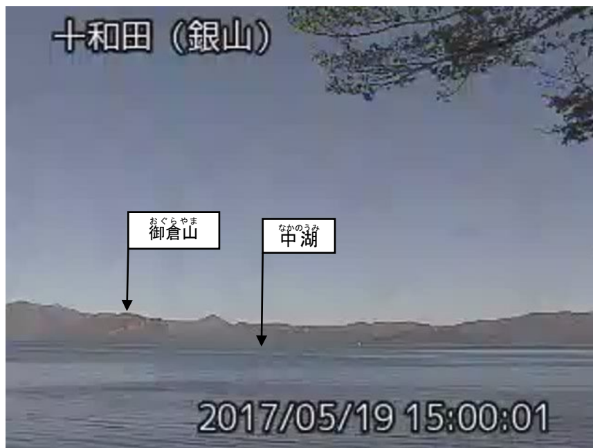
図 1 十和田 中湖周辺の状況（5月19日）