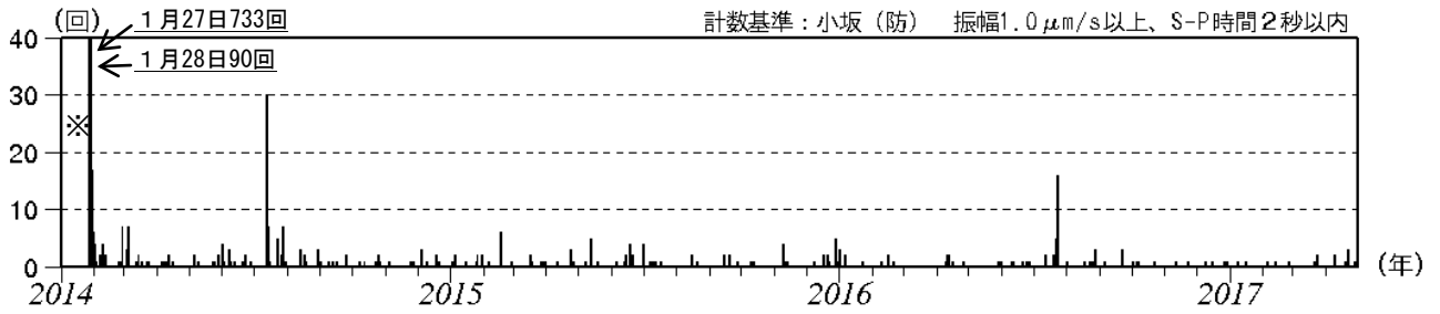
図 2 十和田 日別地震回数（2014 年 1 月～2017 年 4 月）