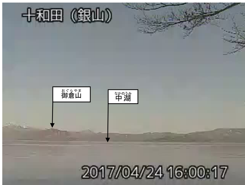
図 1 十和田 中湖周辺の状況（4月24日）