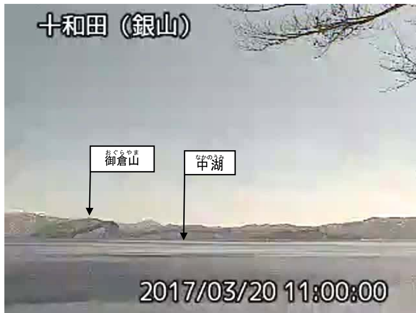
図 1 十和田 中湖周辺の状況（3月20日）