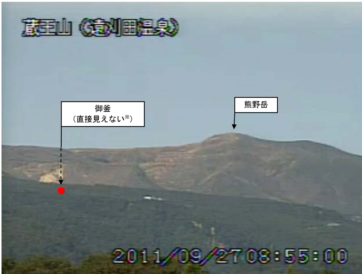
図2 蔵王山 遠望カメラの映像（9月27日08時55分頃） 遠刈田温泉（山頂の東約15km）に設置してある遠望カメラによる。 ※御釜から噴気が噴出した場合、高さ200m以上のときに観測されます。