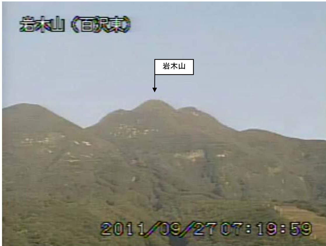
図2 岩木山 遠望カメラの映像（9月27日07時20分頃） 百沢東（山頂の南東約4km）に設置してある遠望カメラによる。