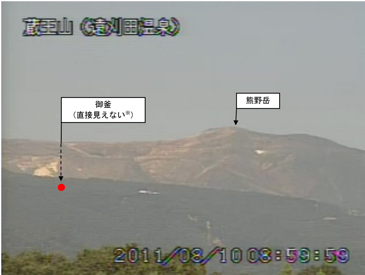
図2 蔵王山 遠望カメラの映像（8月10日09時00分頃）