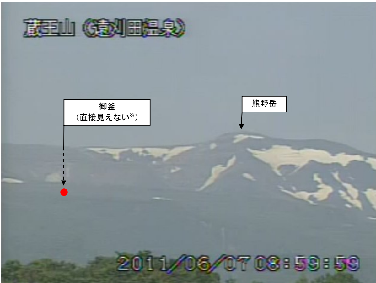
図2 蔵王山 遠望カメラの映像（6月7日09時00分頃）