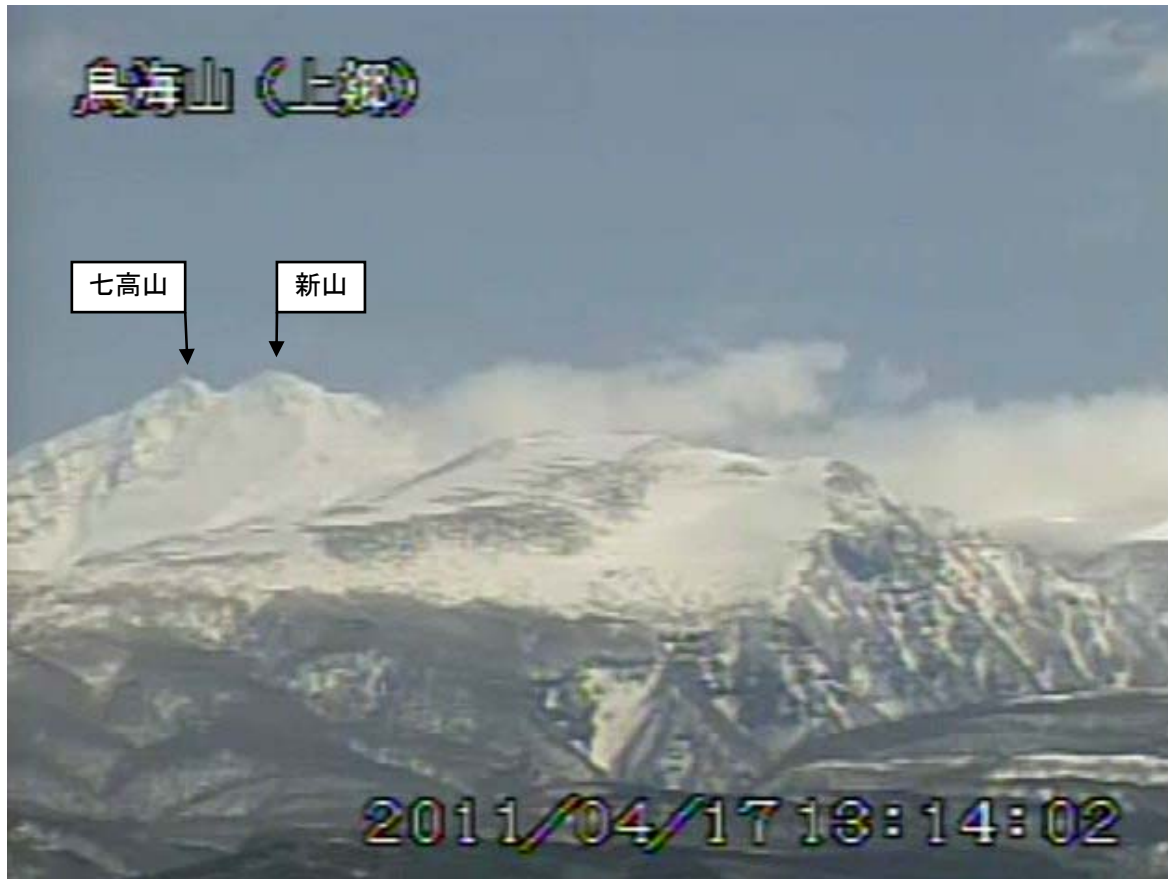
図2 鳥海山 遠望カメラの映像（4月17日13時14分頃） 上郷（山頂の北西約10km）に設置してある遠望カメラによる。