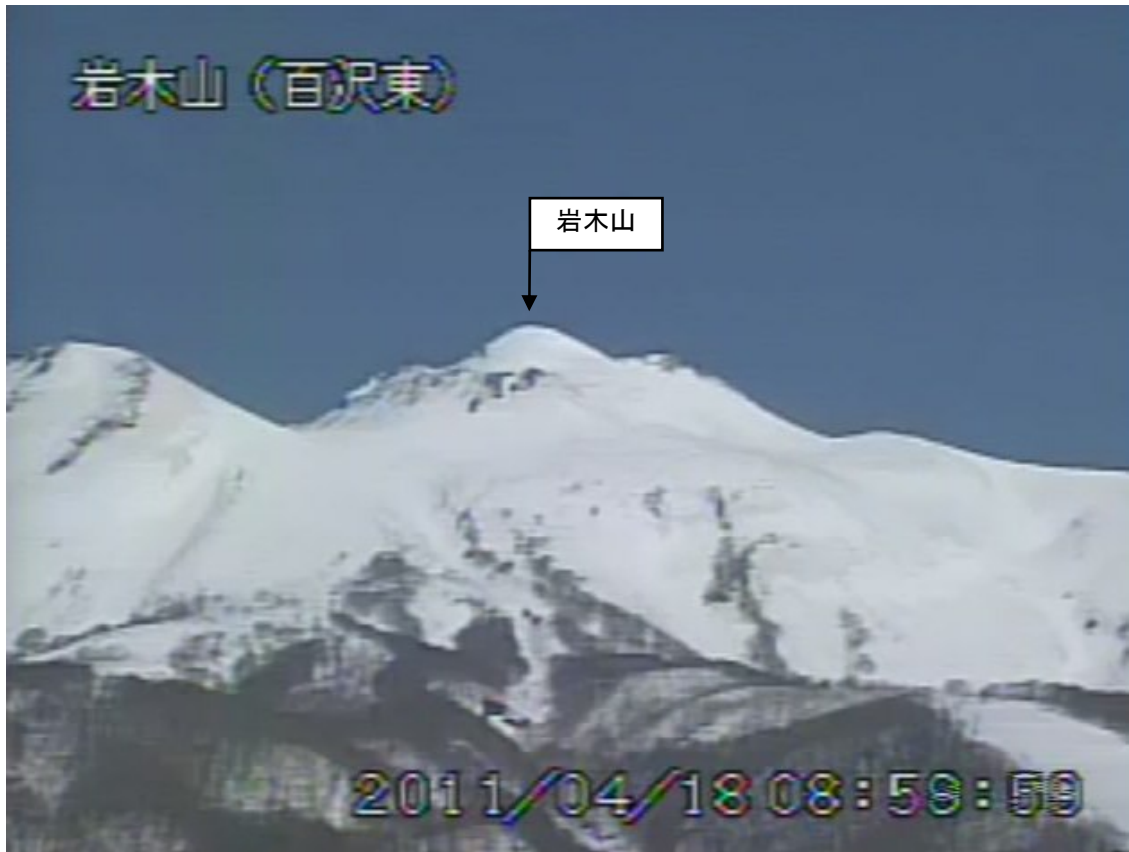
図2 岩木山 遠望カメラの映像（4月18日09時00分頃） 百沢東（山頂の南東約4km）に設置してある遠望カメラによる。