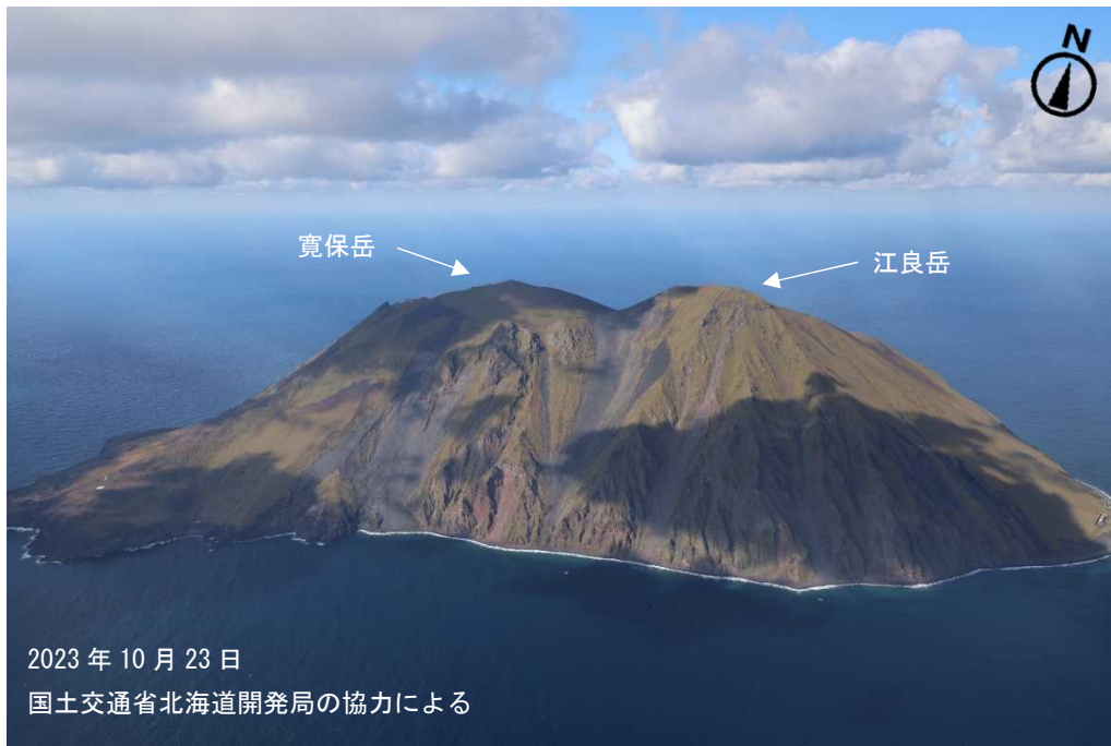
図2 渡島大島 島全体の状況 南側上空（図1の①）から撮影