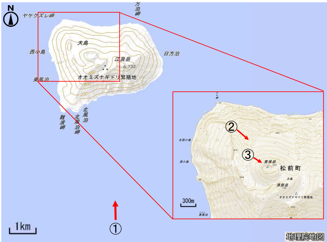
図1 渡島大島 写真及び赤外熱映像の撮影方向（矢印）

6日に国土交通省北海道開発局の協力により上空からの観測を実施しました。山頂部の寛保岳（中央火口丘）及びその周辺に噴気は認められず、地形や植生にも特段の変化はありませんでした。また、赤外熱映像装置による観測では、寛保岳の火口南東側内壁にこれまでと同様の弱い地熱域を確認しました。