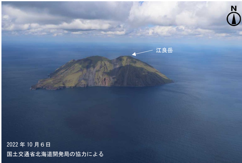
図2 渡島大島 島全体の状況 南側上空（図1の①）から撮影