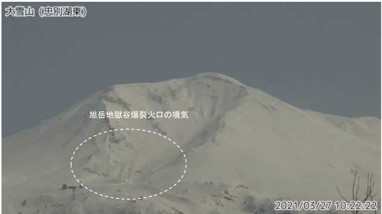
図2 大雪山 西側から見た旭岳の状況（3月27日、忠別湖東監視カメラによる）