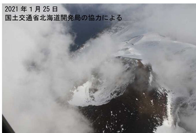
2021年1月25日 国土交通省北海道開発局の協力による