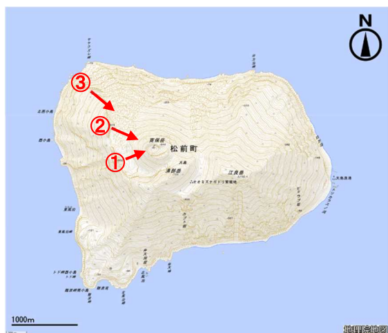
図1 渡島大島 火口周辺図

25日に上空からの観測（国土交通省北海道開発局の協力による）を実施しました。噴気は認められず、赤外熱映像装置による観測では、寛保岳の南東側内壁に引き続き弱い地熱域が認められました。