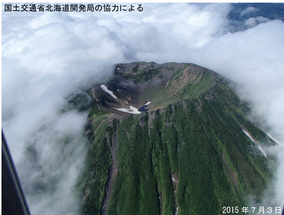
図 2 羊蹄山 山頂部周辺の状況 図 1 - ①から撮影