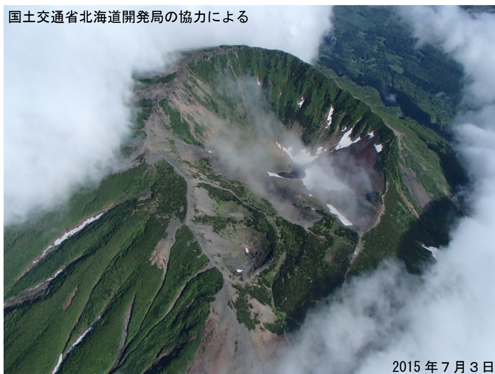
図 3 羊蹄山 山頂火口周辺の状況 図 1 - ②から撮影