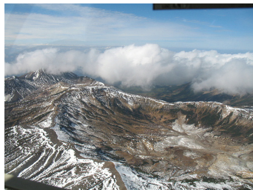
図 2 大雪山 御鉢平カルデラ（2006 年 10 月 2 日 北東側上空 火口周辺図①方向から撮影）