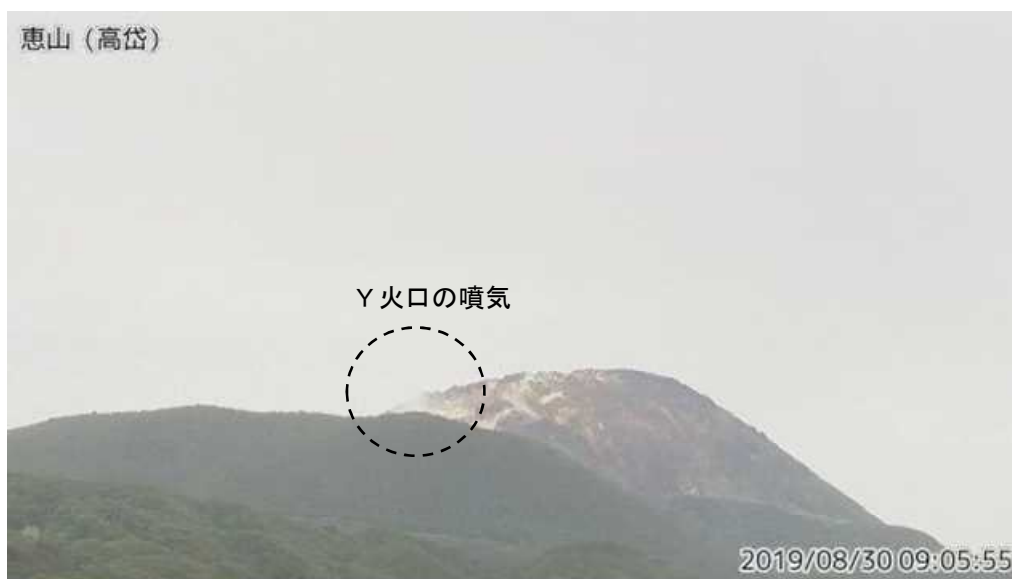
図1 恵山 西南西側から見た山頂部の状況（8月30日、 たかだい 高岱監視カメラによる）

この火山活動解説資料は札幌管区気象台のホームページ（ https://www.jma-net.go.jp/sapporo/ ）や気象庁のホームページ（ https://www.data.jma.go.jp/svd/vois/data/tokyo/STOCK/monthly_v-act_doc/monthly_vact.php ）でも閲覧することができます。