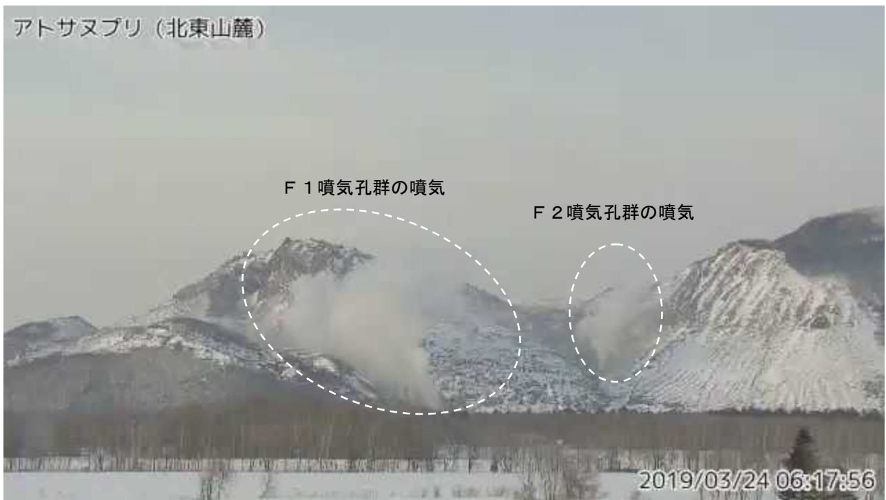
図2 アトサヌプリ 北東側から見た山体の状況 (3月24日、北東山麓監視カメラによる)