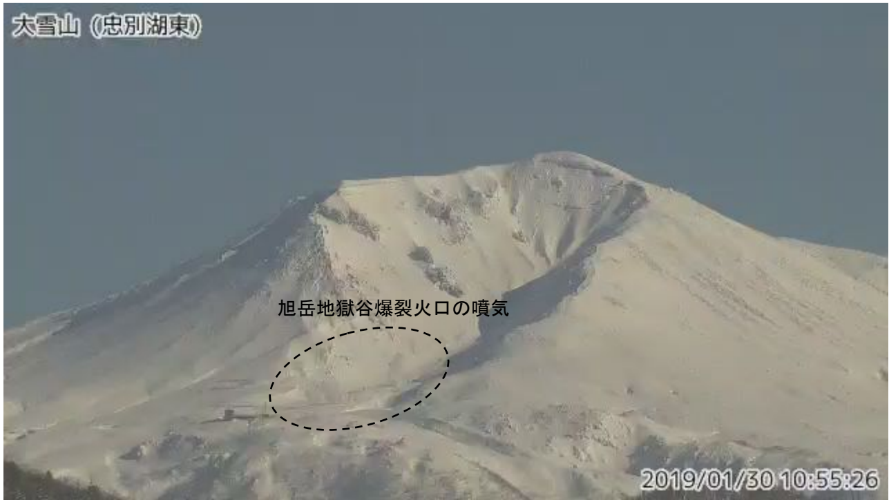
図2 大雪山 西側から見た旭岳の状況 (1月30日、忠別湖東監視カメラによる)