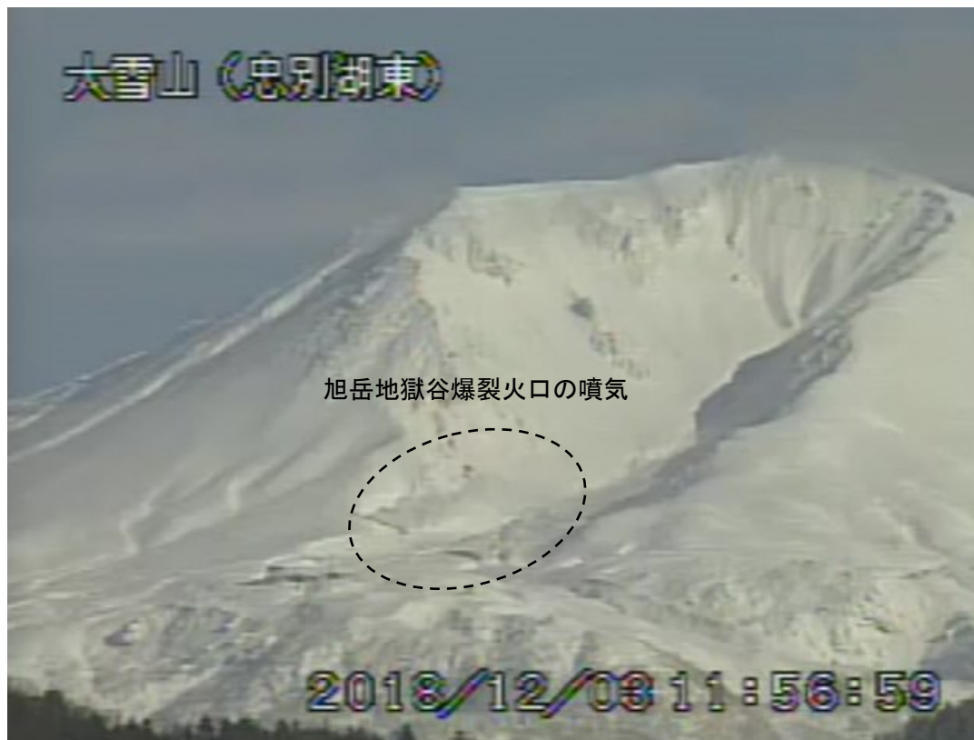
図2 大雪山 西側から見た旭岳の状況 (12月3日、 ちゅうべつこひがし 忠別湖東監視カメラによる)