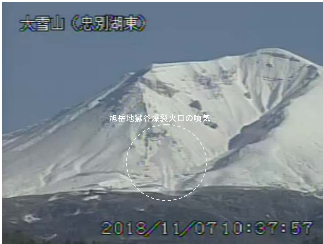
図2 大雪山 西側から見た旭岳の状況 (11月7日、 ちゅうべつこひがし 忠別湖東監視カメラによる)