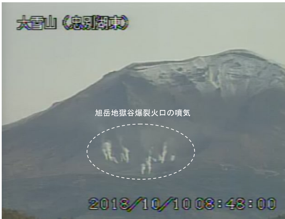
図2 大雪山 西側から見た旭岳の状況 (10月10日、 ちゅうべつこひがし 忠別湖東監視カメラによる)