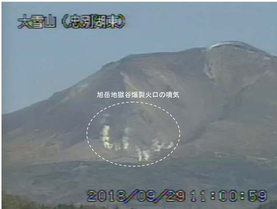
図2 大雪山 西側から見た旭岳の状況（9月29日、 ちゅうべつこひがし 忠別湖東監視カメラによる）