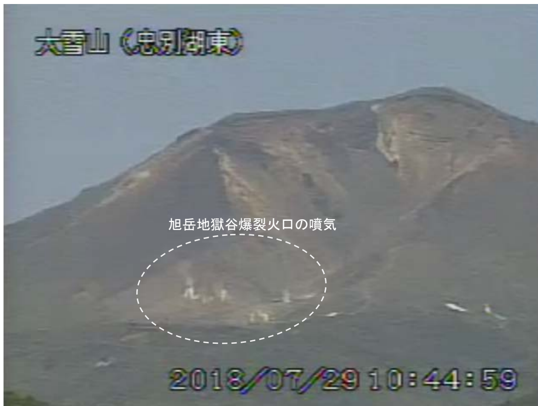
図2 大雪山 西側から見た旭岳の状況（7月29日、 ちゅうべつこひがし 忠別湖東監視カメラによる）