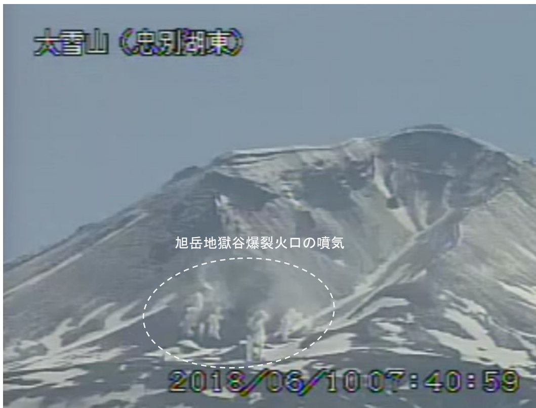
図2 大雪山 西側から見た旭岳の状況（6月10日）