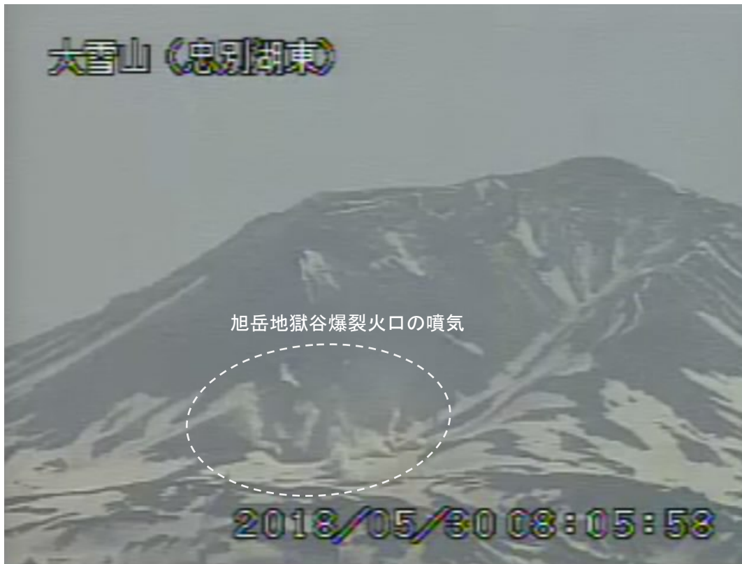
図2 大雪山 西側から見た旭岳の状況（5月30日、忠別湖東監視カメラによる）