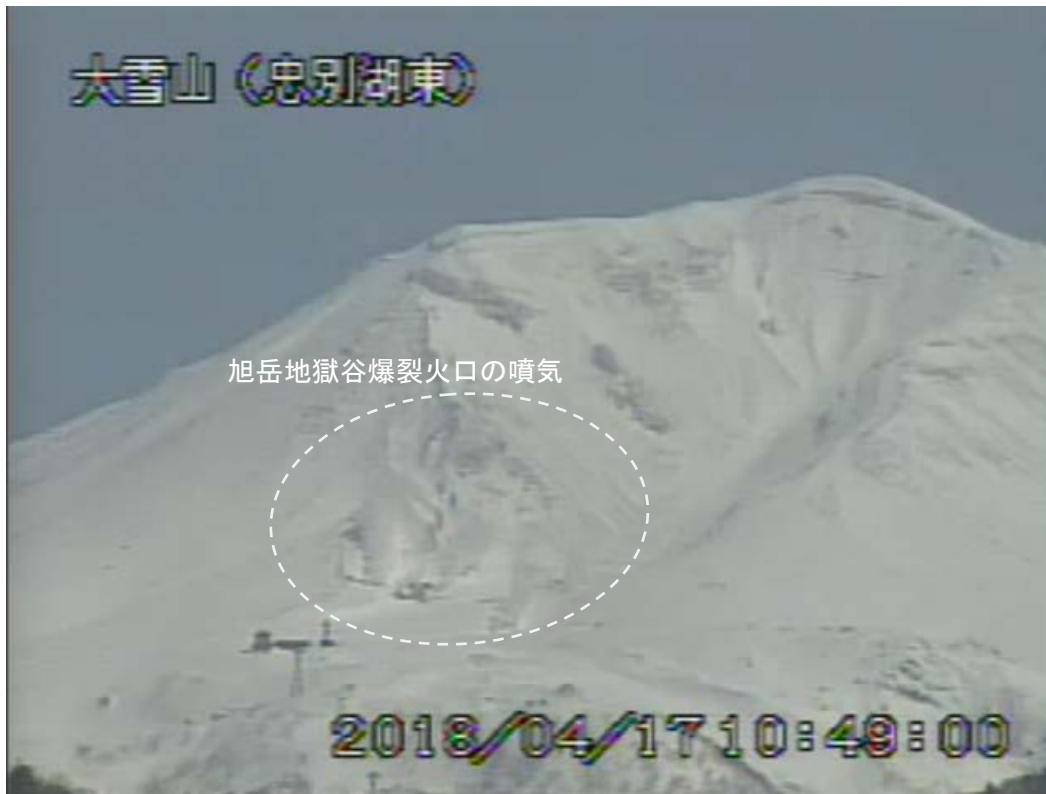
図2 大雪山 西側から見た旭岳の状況（4月17日、 ちゅうべつこひがし 忠別湖東監視カメラによる）