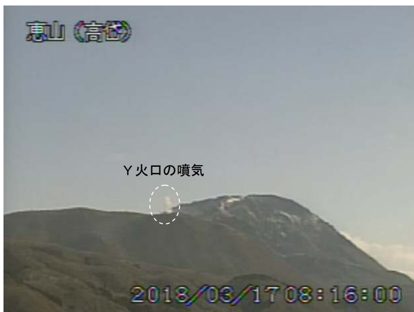
図1 恵山 西南西側から見た山頂部の状況（3月17日、 たかだい 高岱監視カメラによる）

1) GNSS (Global Navigation Satellite Systems) とは、GPSをはじめとする衛星測位システム全般を示す呼称です。