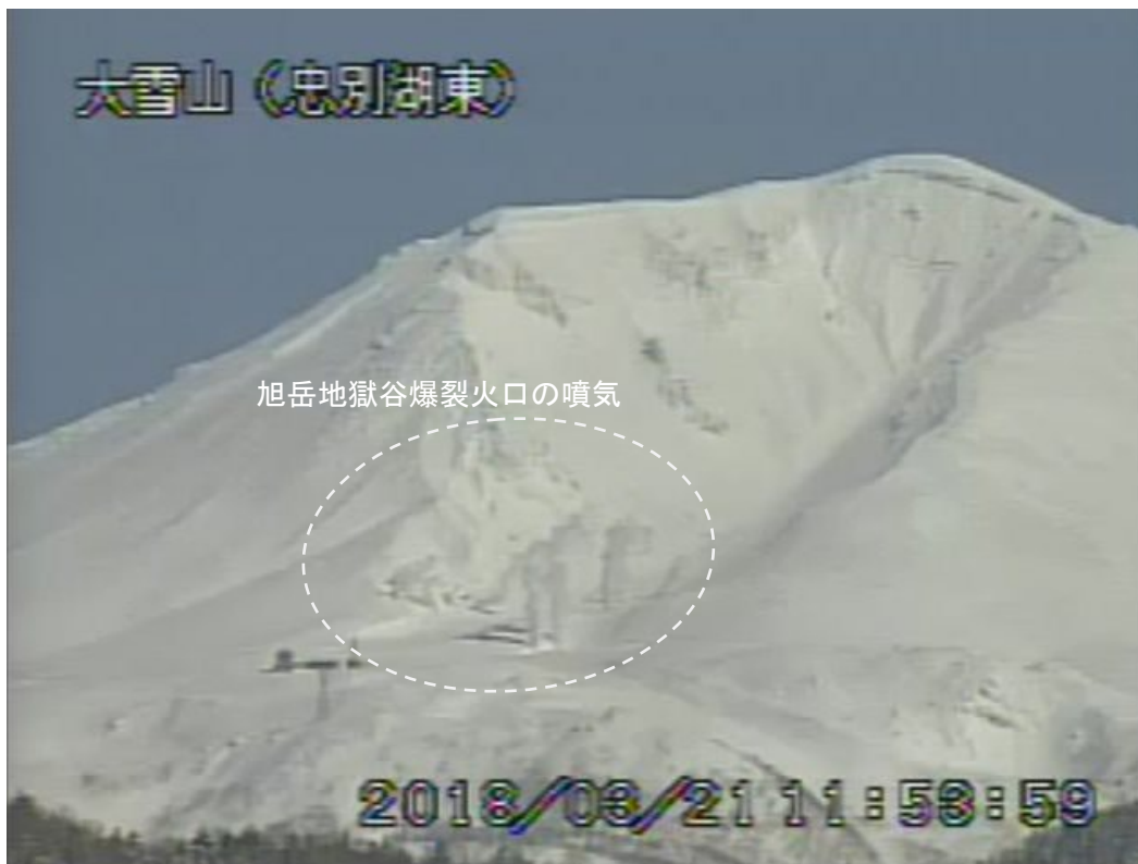
図2 大雪山 西側から見た旭岳の状況（3月21日、忠別湖東監視カメラによる）