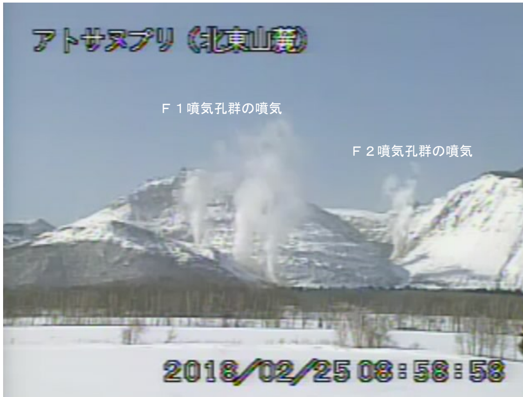
図2 アトサヌプリ 北東側から見た山体の状況 （2月25日、北東山麓監視カメラによる）