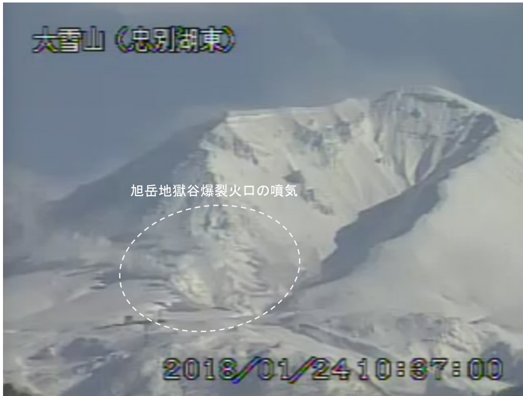
図2 大雪山 西側から見た旭岳の状況 (1月24日、忠別湖東監視カメラによる)