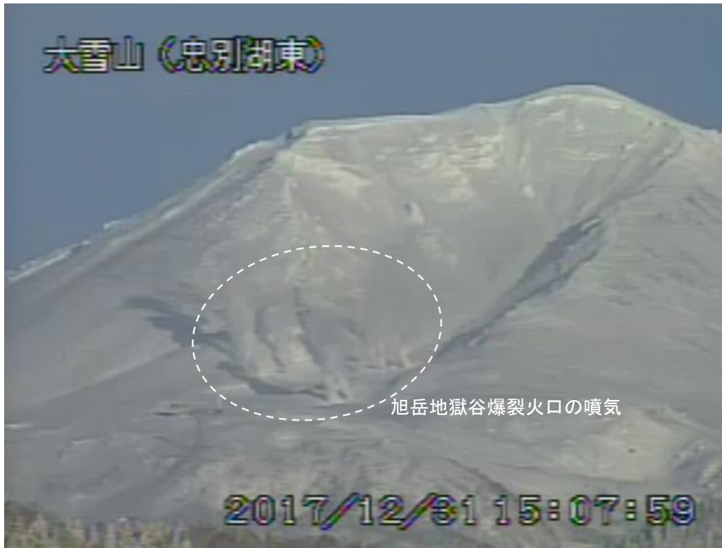
図2 大雪山 西側から見た旭岳の状況 (12月31日、忠別湖東監視カメラによる)