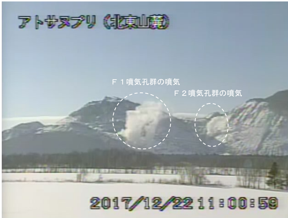
図2 アトサヌプリ 北東側から見た山体の状況 (12月22日、北東山麓監視カメラによる)