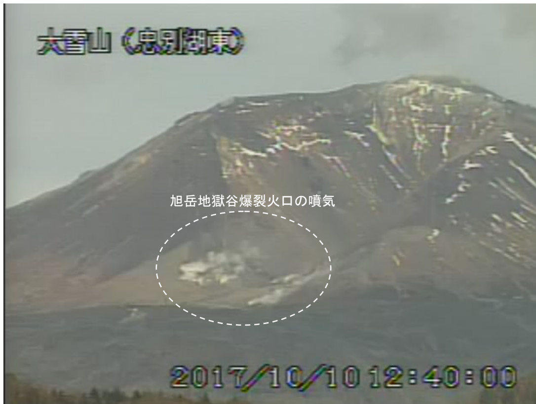
図2 大雪山 西側から見た旭岳の状況 (10月10日、忠別湖東監視カメラによる)