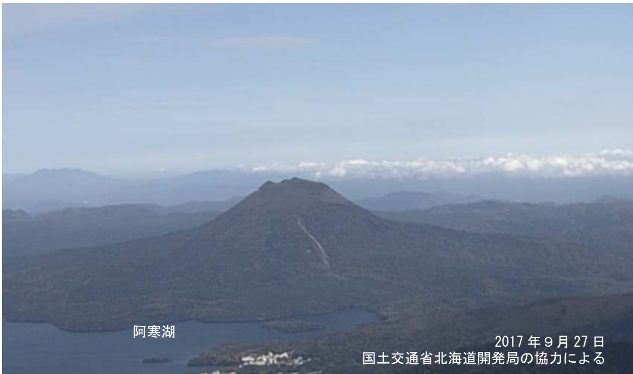
図2 雄阿寒岳 全景 南西側上空 (図1の①) から撮影