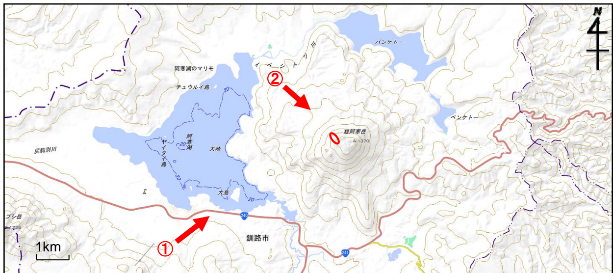
図 1 雄阿寒岳 周辺図と写真及び赤外熱映像の撮影方向（矢印）