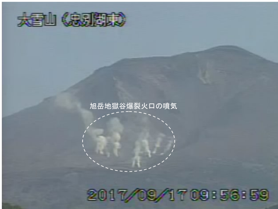
図2 大雪山 西側から見た旭岳の状況 (9月17日、 ちゅうべつこひがし 忠別湖東監視カメラによる)