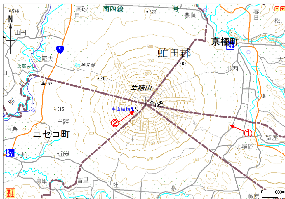
図 1 羊蹄山 周辺図と赤外熱映像及び写真の撮影方向（矢印）

1) 赤外熱映像装置は、物体が放射する赤外線を検知して温度や温度分布を測定する計器です。熱源から離れた場所から測定できる利点がありますが、測定距離や大気等の影響で実際の熱源の温度よりも低く測定される場合があります。