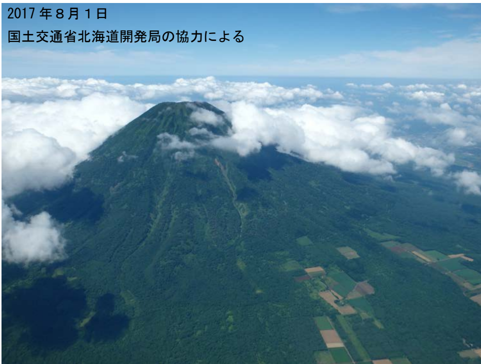
図 2 羊蹄山 山体周辺の状況 南東側上空（図 1 の①）から撮影