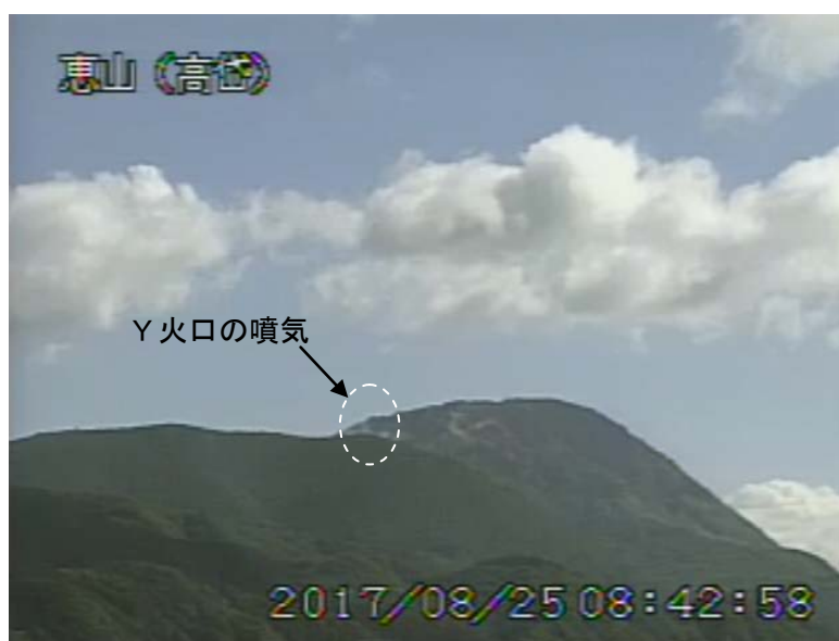
図1 恵山 西南西側から見た山頂部の状況（8月25日、高岱 たかだい 監視カメラによる）

1) GNSS (Global Navigation Satellite Systems) とは、GPSをはじめとする衛星測位システム全般を示す呼称です。